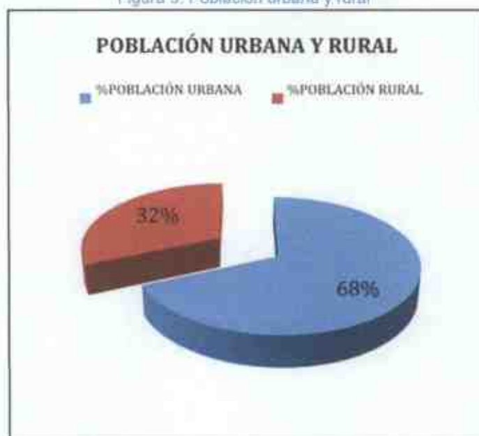
Figura 3. Población urbana y rural

La población de Pichincha que vive en -el sector urbano alcanza un 68% del total, 1.761.867 habitantes, mientras que la rural suma 814.420 habitantes con 32%, siendo el cantón Rumiñahui el que tiene el mayor porcentaje de población urbana 87% y 75.080 habitantes. El DMQ alcanza el mayor número de población urbana 1.607.732 habitantes y un índice del 72%. Los cantones de Puerto Quito y Mejía tienen más del 80% de población rural con 17.365 y 64.820 habitantes, en su orden. La población de Pichincha es mayoritariamente urbana, con una concentración en el DMQ y Rumiñahui.